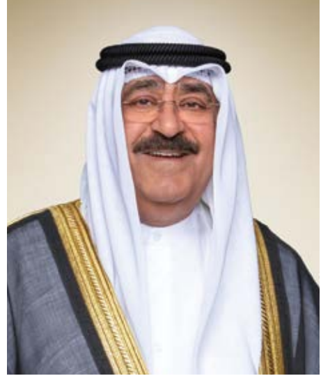
حضرة صاحب سمو الشيخ مشعل الأحمد الجابر الصباح أمير دولة الكويت