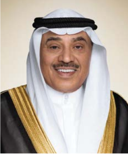
سمو الشيخ صباح خالد الصباح ولي عهد دولة الكويت